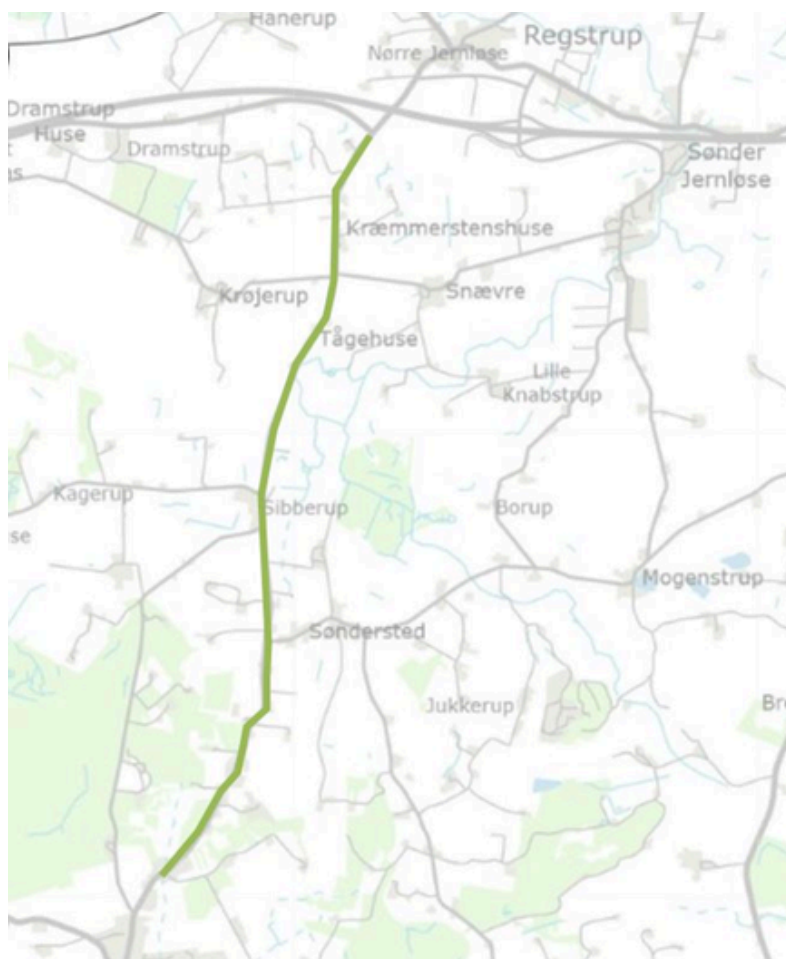
Figur 1 Cykelsti Undløse - Nr. Jernløse (princip)

Cykelstiprojektet er med på listen over cykelstionsker, det er blandt andet ønsket af Undløse Lokalforum.