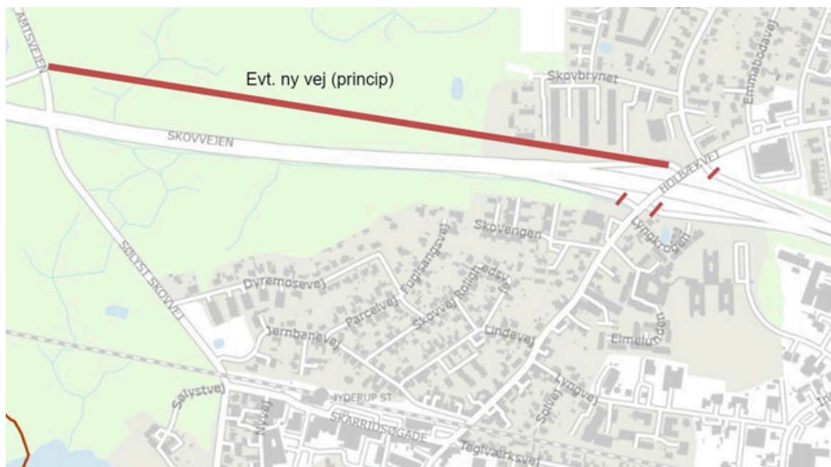
Figur 3 Mulig løsning med ny vej mellem Amtsvæjen og Holbækvej

Det vil efter administrationens opfattelse kunne give en bedre afvikling af trafikken i Jyderup centrum, så området omkring Jyderup Station og Skarridsøgade ikke belastes yderligere.