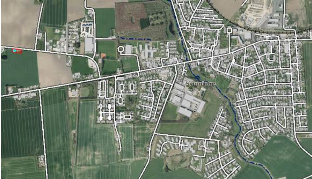
Detaljekort Svinninge, Nordgårdsvej, rød afmærkning er areal beskrevet ovenfor