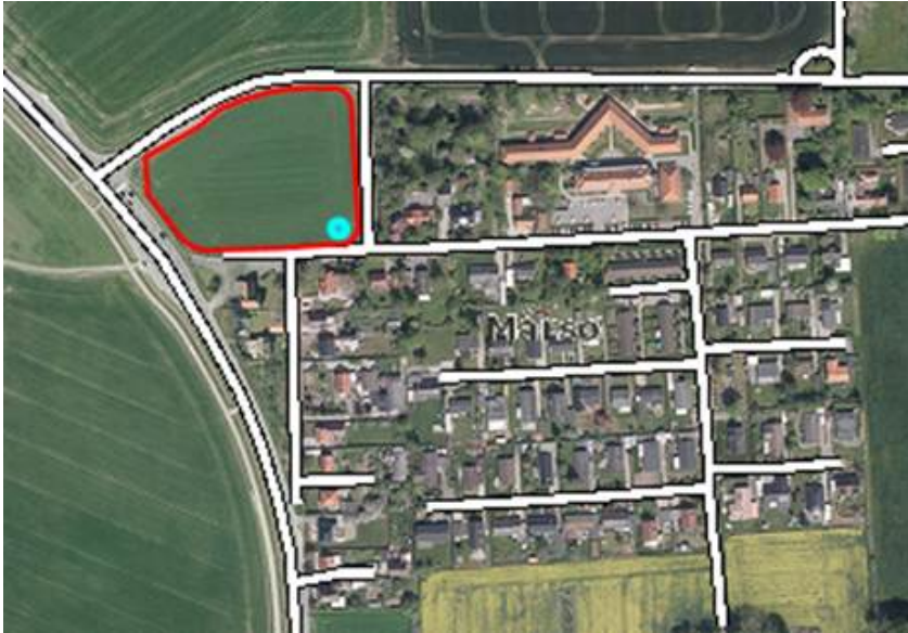
Detaljerkort Gl. Tuse Næs Vej 7, rød afmærkning er areal beskrevet ovenfor