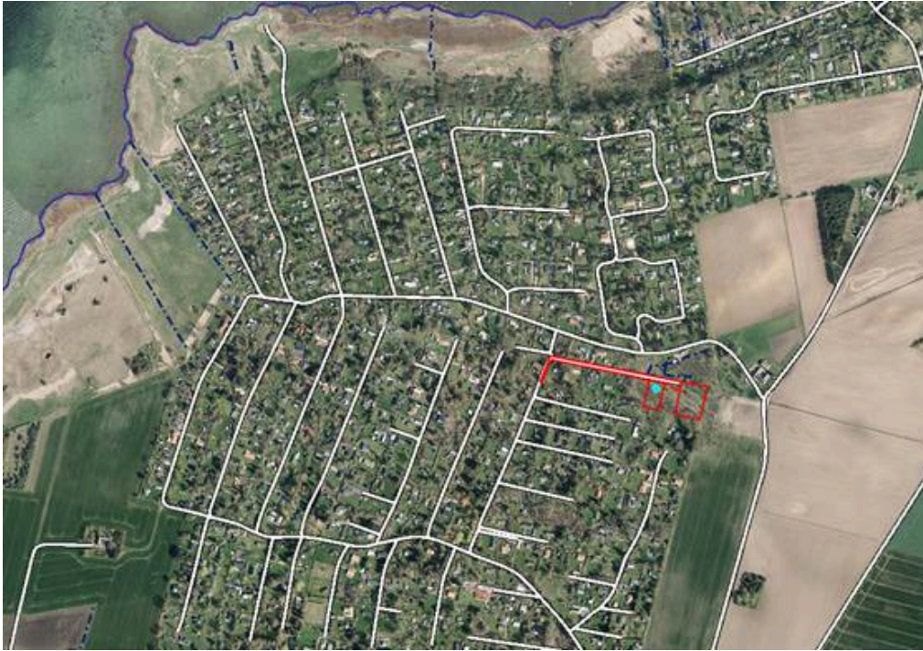
Detaljekort Tjørnerenden, rød afmærkning er areal beskrevet ovenfor