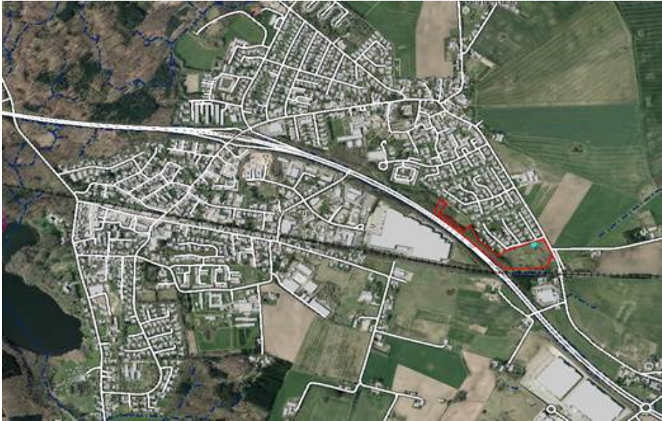
Detaljekort Elmegården 228 og 230, rød afmærkning er areal beskrevet ovenfor