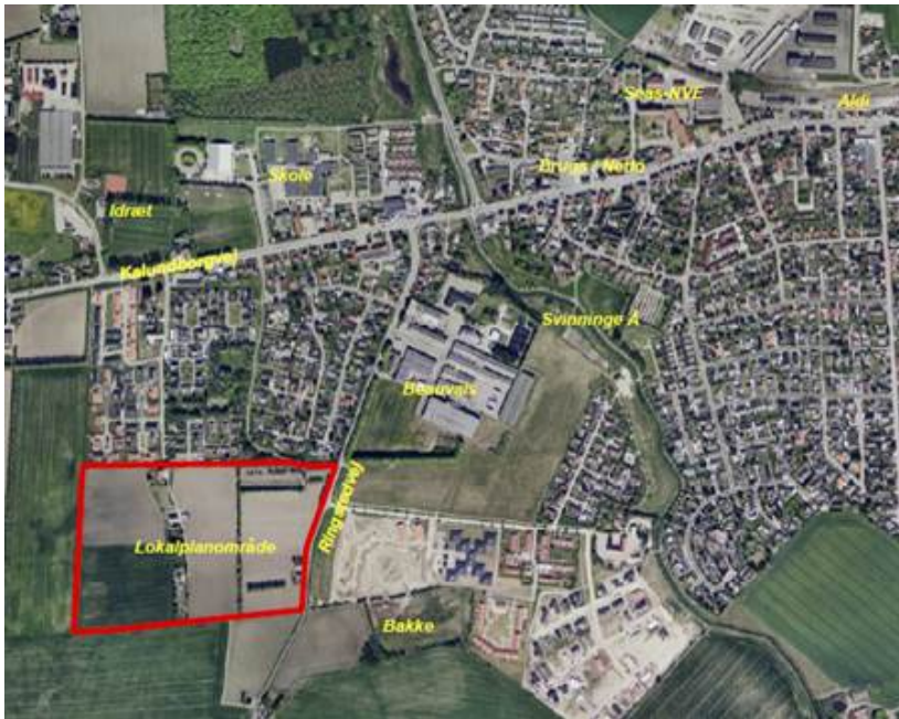
Kortoversigt Landlystvej/Ringstedvej, rød afmærkning er areal beskrevet ovenfor