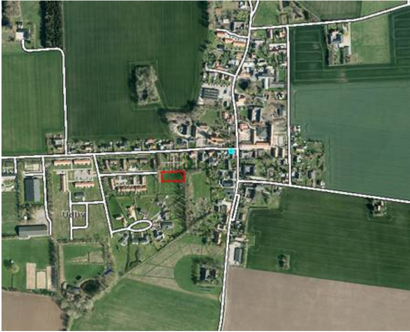
Detaljekort Udby Kirkevej, rød afmærkning er areal beskrevet ovenfor