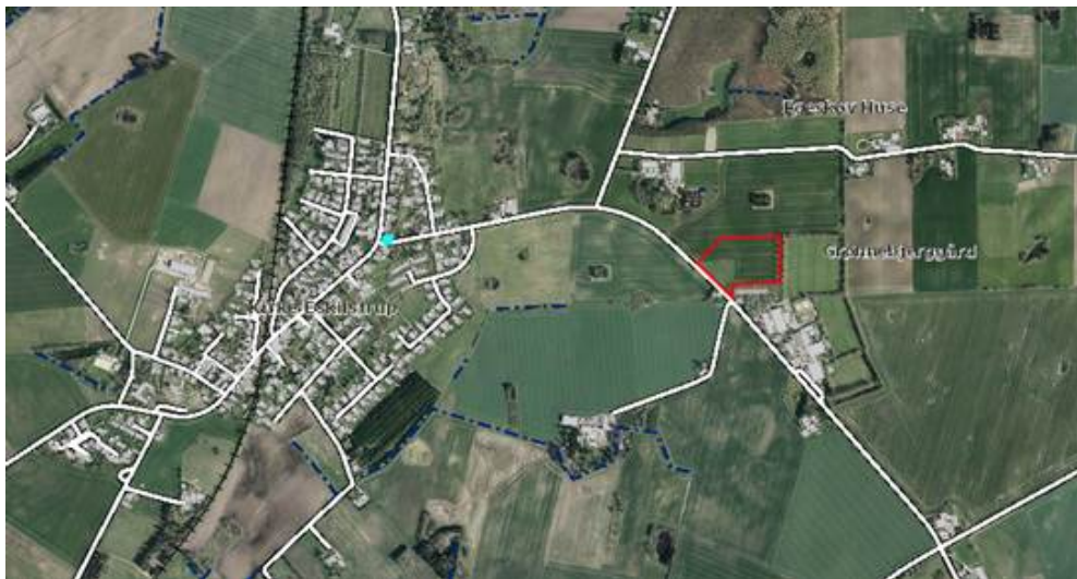
Detaljerkort Stestrupvej, Kr. Eskilstrup, rød afmærkning er areal beskrevet ovenfor